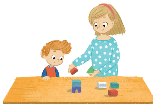
1. Uczenie się poprzez obserwację, szukanie wzorców, modelowanie.