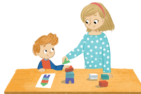
2. Samodzielne uczenie się zgodnie z zaproponowaną instrukcją, korzystanie z doświadczeń i wsparcia innych osób.