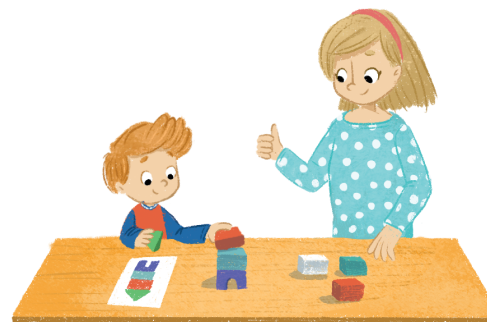
3. Samodzielne konstruowanie wiedzy na podstawie doświadczeń pracy z innymi, instrukcji i własnych pomysłów.