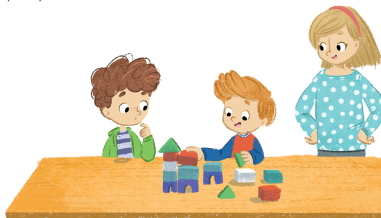
4. Tutoring rówieśniczy – wspólne konstruowanie wiedzy w umyśle, korzystanie z wiedzy innych osób i uczenie rówieśników zgodnie z własnymi umiejętnościami i wiedzą.